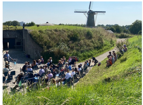
Magisch talent, op zondagmiddag (ca 75 bezoekers)