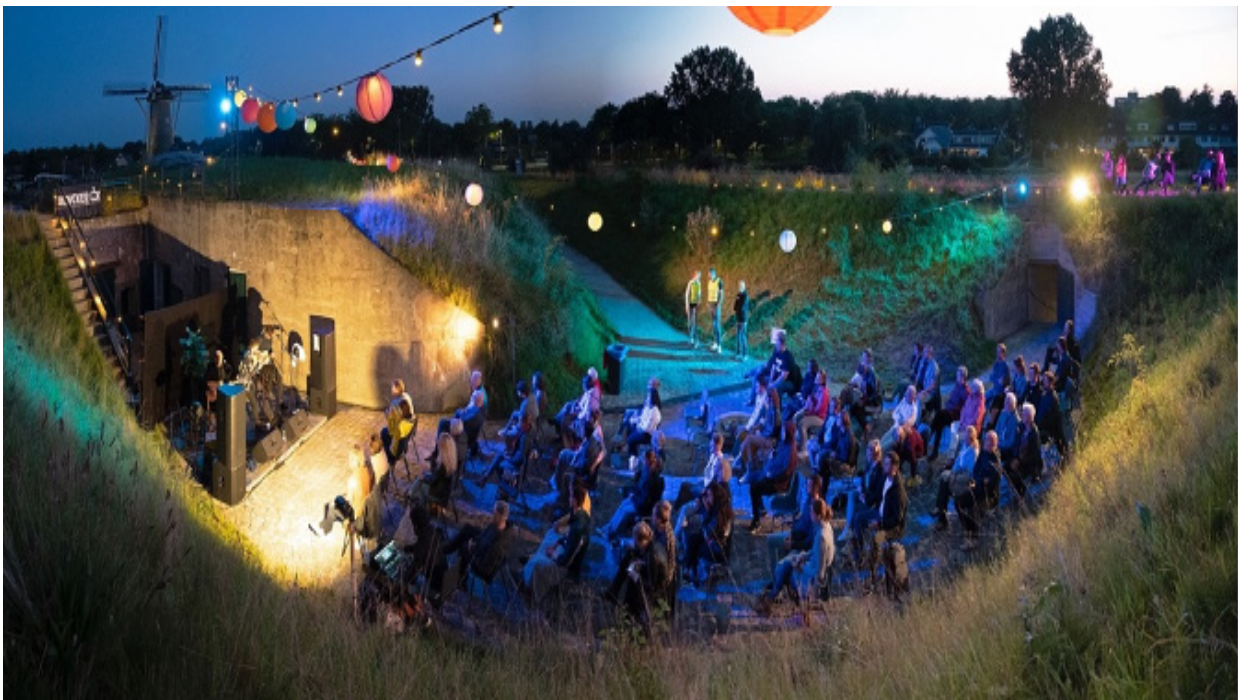
Handsome poets (ca 100 bezoekers)